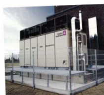
Demolition plant in Germany Page 84 [富士電機システムズ Fuji Electric systems]

2011 燃料電池開発情報センター Fuel Cell Development Information Center