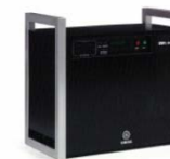
External view of YAMAHA POPS Page 180 [ヤマハ発動機 Yamaha Motor]