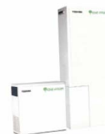
Commercialized Residential PEFC Page 160 [東芝燃料電池システム Toshiba Fuel Cell Power Systems]