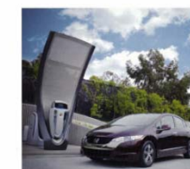
FCX Clarity & Solar Hydrogen Station Page 194 [本田技術研究所 Honda R&D]