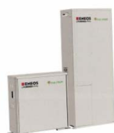
Commercialized Residential PEFC Page 137 [ENEOS セルテック ENEOS CELLTECH]