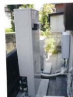
1kw class residential SOFC Page 103 [豊田ガス Saibu Gas]