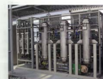
3Nm³/h Demo-scale apparatus Page 190 [神戸製鋼所 Kobe Steel]