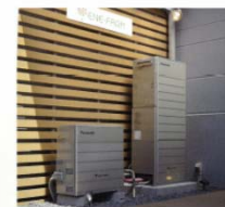
Commercialized Residential PEFC Page 164 [パナソニック Panasonic Corporation]