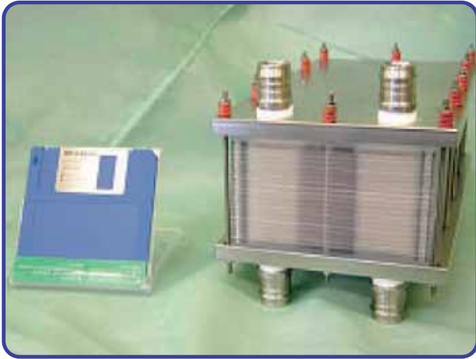
1kW級全熱交換型加湿器（三菱電機）