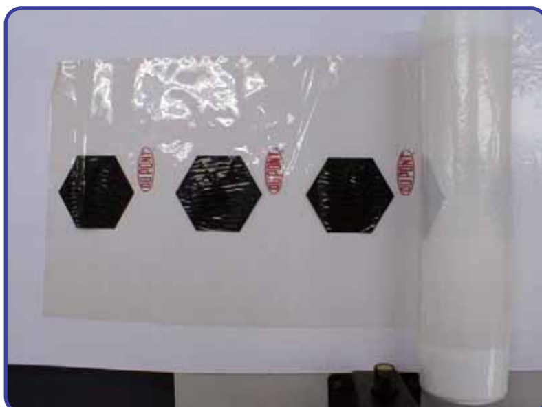
Dupont 3-layer MEA (デュポン)