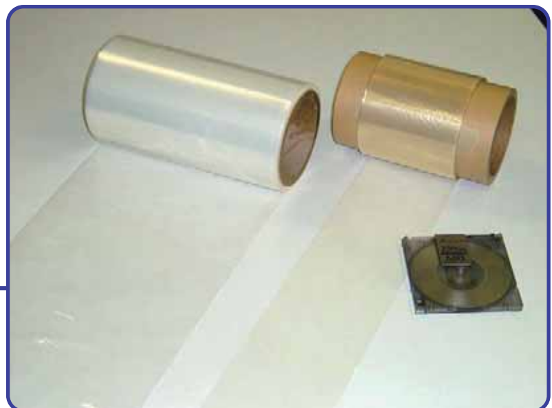
細孔フィリング電解質膜 (東亜合成)