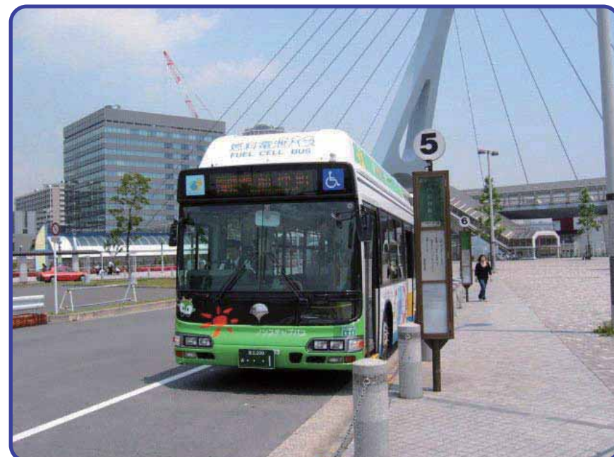
出発を待つ燃料電池バス （運行 東京都交通局）